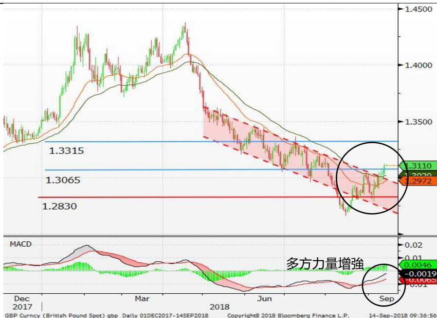
图 3：英镑/美元 - 日线图：英镑突破下行通道。多方力量增强，这支持英镑突破 1.3065 的阻力位。若英镑能站稳该水平，下行走势或暂时完结。