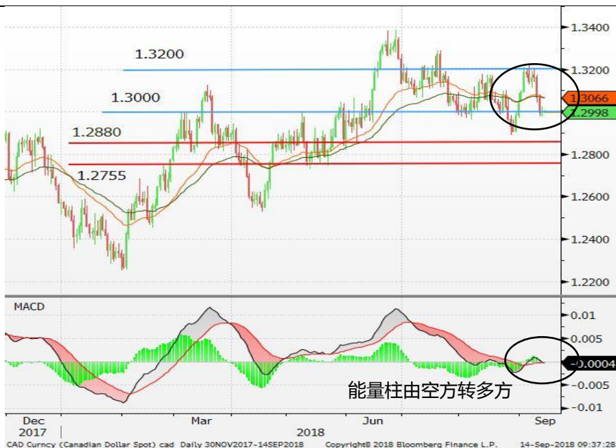
图5：美元/加元 - 日线图：美元/加元显著走低，并下试1.3000的支持位。能量柱或由多方转向空方，这料增添美元/加元的下行压力。