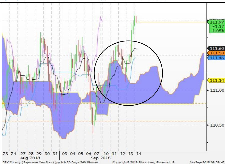
图4：美元/日元 - 4小时图：随着转换线（黑）由下往上穿越基准线（蓝），美元/日元反覆向上。短期内，美元/日元料维持上行的走势。