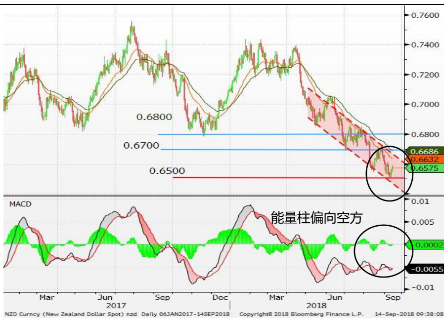
图 7：纽元/美元 - 日线图：纽元维持反覆下行的走势，惟短线触及 0.6500 的支持位后反弹。短期内，技术指标依然偏向空方，纽元难以扭转弱势。