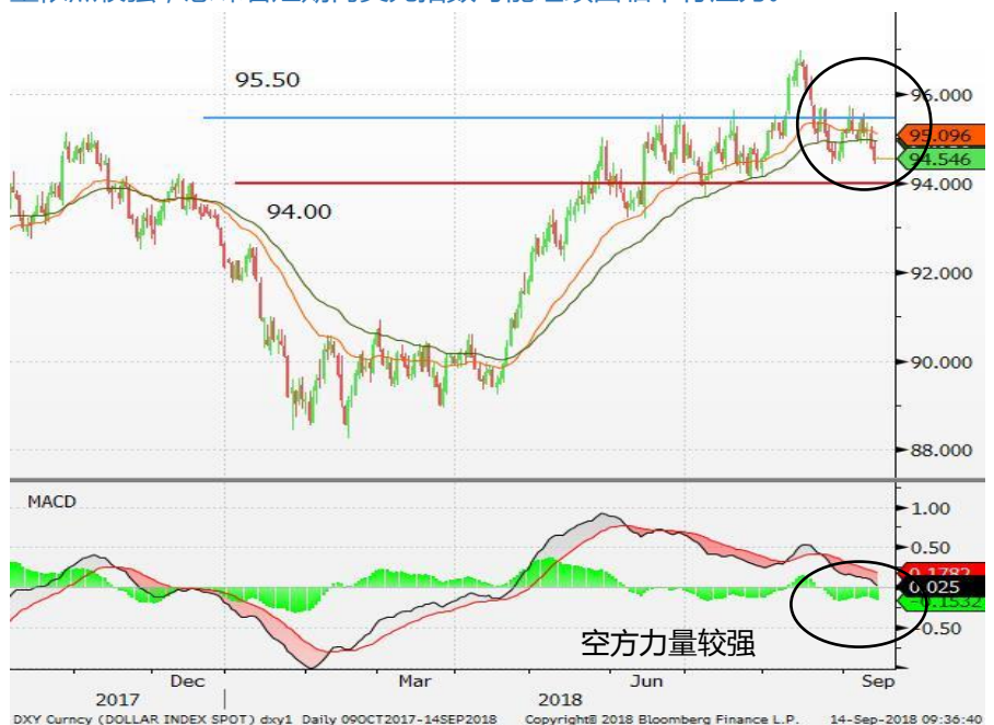
图1：美元指数 -日线图：受制于95的阻力位，美元指数反覆回落。空方力量依然较强，意味着短期内美元指数可能继续面临下行压力。