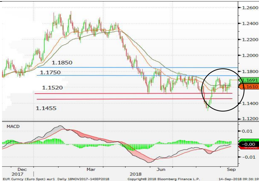
图 2：欧元/美元 - 日线图：欧元继续在两条移动平均线的附近好淡争持。除非出现明显转向，否则欧元维持在 1.1520-1.1750 区间波动的机会较高。